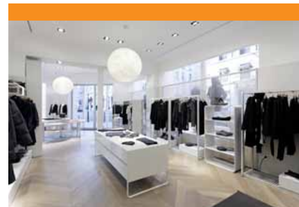
Comptoir des Cotonniers - Place St-Sulpice, Paris 280 m 2 . 6 semaines. 2010 Maître d'œuvre : agence Virga