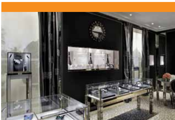
Dior Joaillerie - Place Vendôme, Paris 80 m 2 . 3 mois. 2011 Maître d'œuvre d'exécution : agence Virga