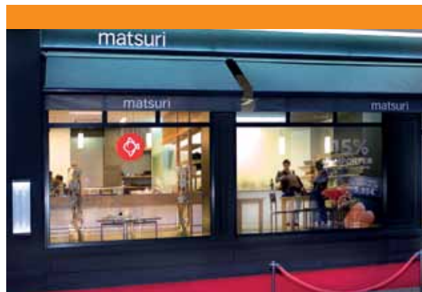
Matsuri - Saint-Etienne 400 m 2 . 4 mois. 2011 Maître d'œuvre : EZCT